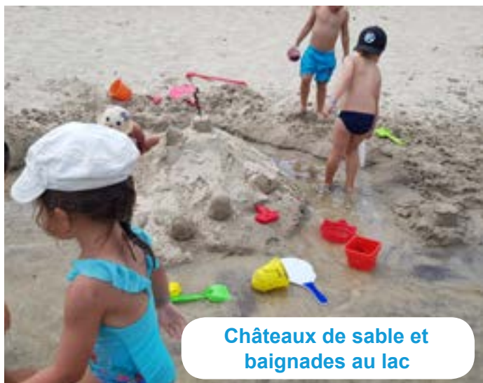
Châteaux de sable et baignades au lac

... de visiter le site archéologique de Brion ou le Fort Médoc pour les plus jeunes