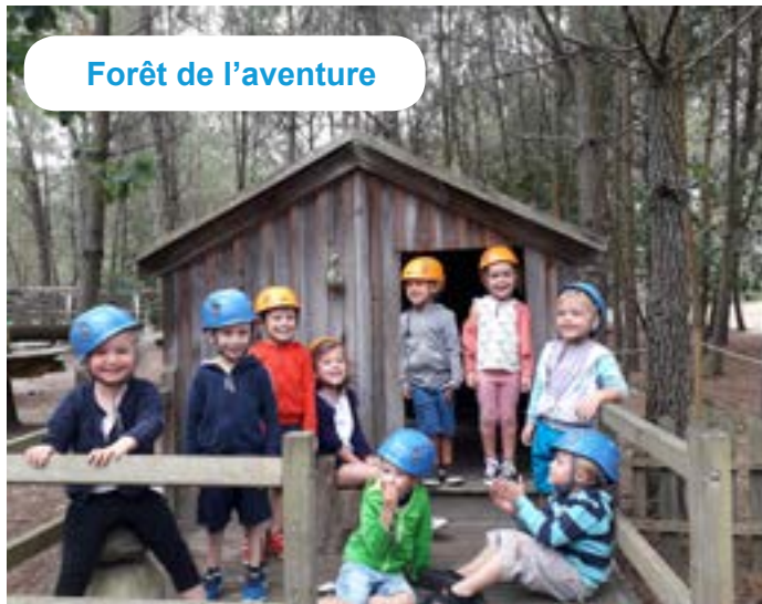
Forêt de l'aventure