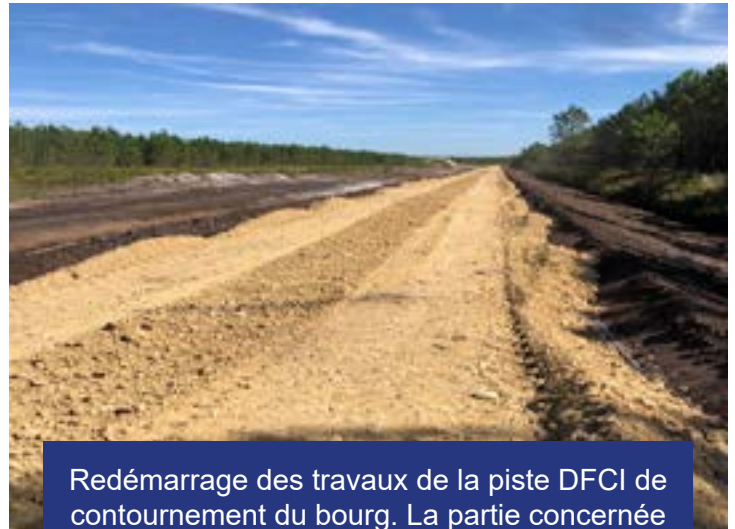
Redémarrage des travaux de la piste DFCI de contournement du bourg. La partie concernée se trouve entre la route de Lesparre et l'intercommunale HOURTIN/NAUJAC.