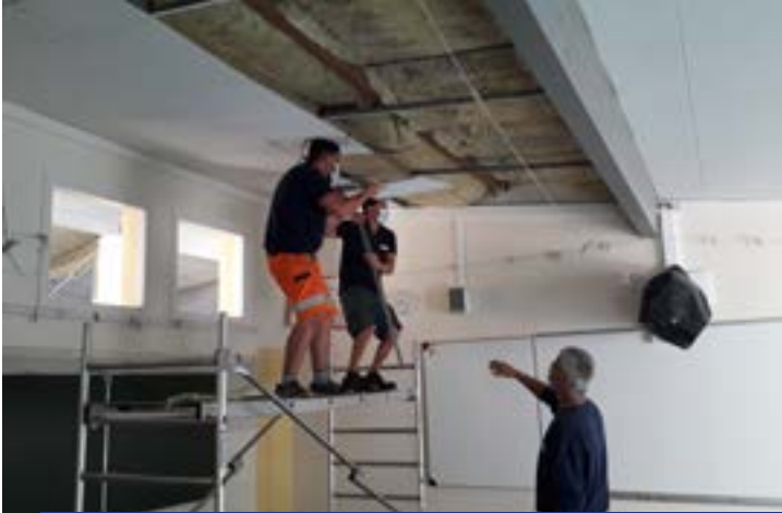
Changement des plafonds et du système d'éclairage LED pour certaines salles de l'école élémentaire.