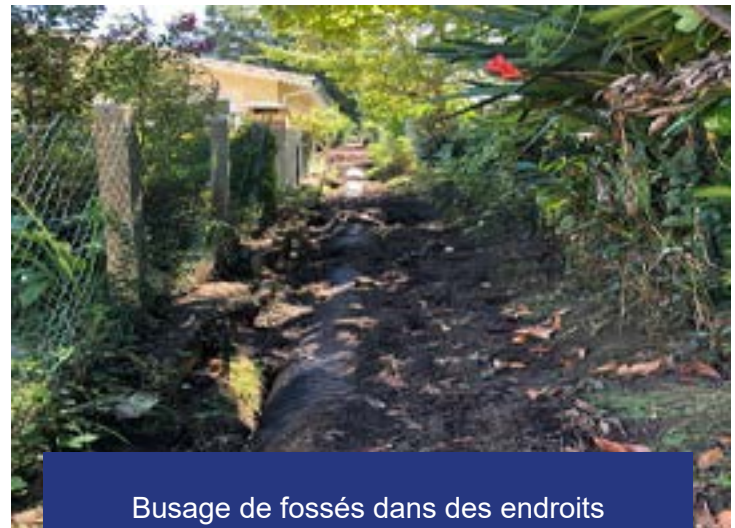
Busage de fossés dans des endroits inaccessibles au nettoyage mécanique pour un meilleur écoulement des eaux.