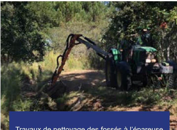
Travaux de nettoyage des fossés à l'épaveuse avant le passage de la pelle mécanique.