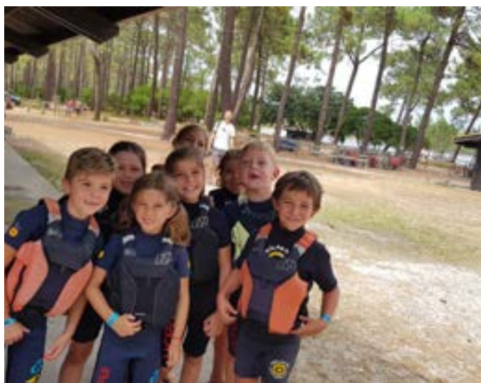
une journée à Bombannes