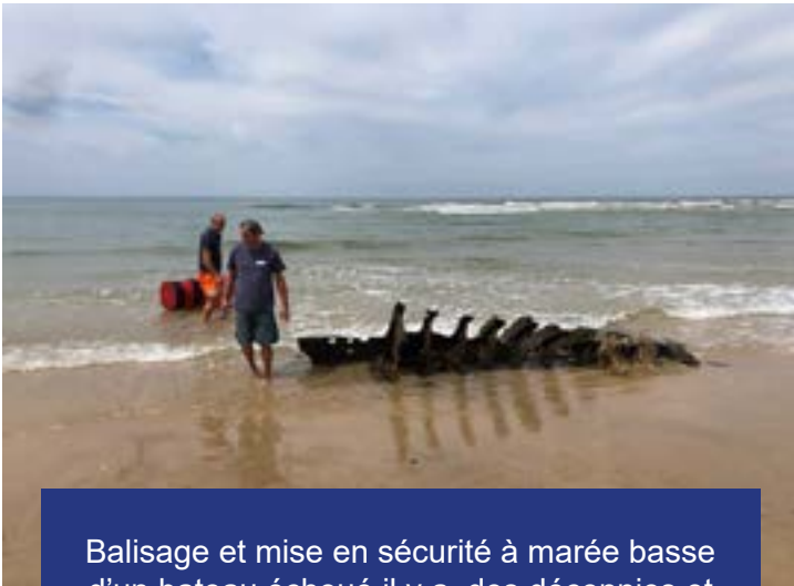
Balisage et mise en sécurité à marée basse d'un bateau échoué il y a des décennies et réapparu au sud de HOURTIN plage.